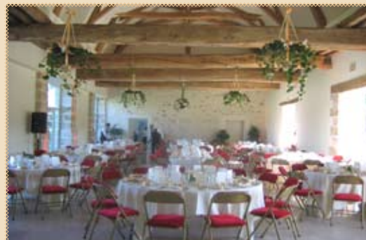
"salle du pressoir" (295m 2 )