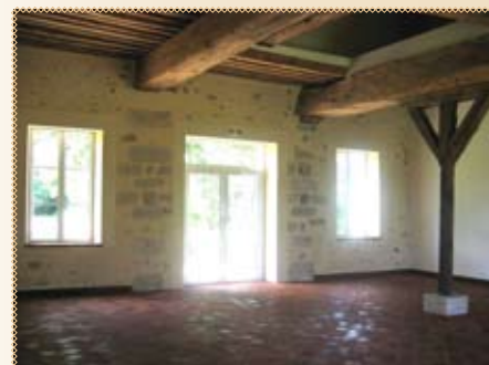
"salle de garde" (95m 2 )