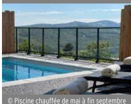
© Piscine chauffée de mai à fin septembre

8 Place Gudin 58120 CHATEAU-CHINON (VILLE) www.auvieuxmorvan.com/