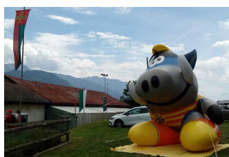
La mascotte des St Léger « Léo »