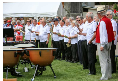
Une délégation du chœur d'hommes de St-Légier