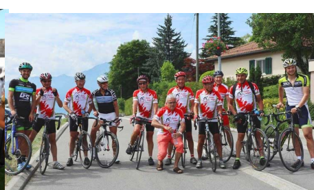
Les cyclistes de St Léger-sous-Cholet, après plus de 750 km, sont accueillis par leurs collègues de St-Légier-La Chiésaz venus à leur rencontre