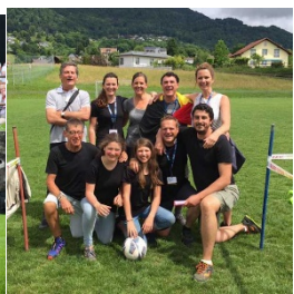
L'équipe victorieuse : les Belges de St Léger en Gaume !

Et durant ce rassemblement, les moments conviviaux