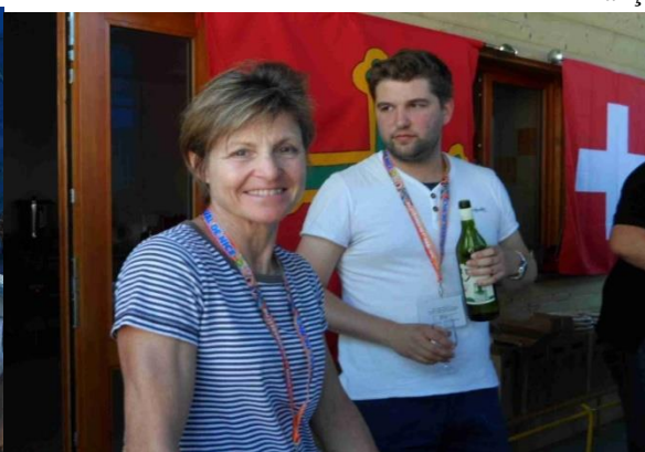
Erika HESS, suisse, championne de ski alpin.