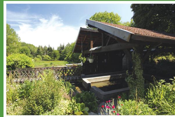
Lavoir de la Fontaine Vannier à Fort-Moville et l'association « Autour du Lavoir »