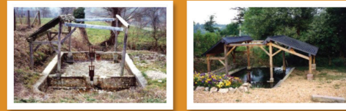
Une restauration remarquable : le lavoir de Manneville la Raoult